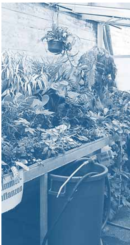
Treibhaus BWZ Lyss