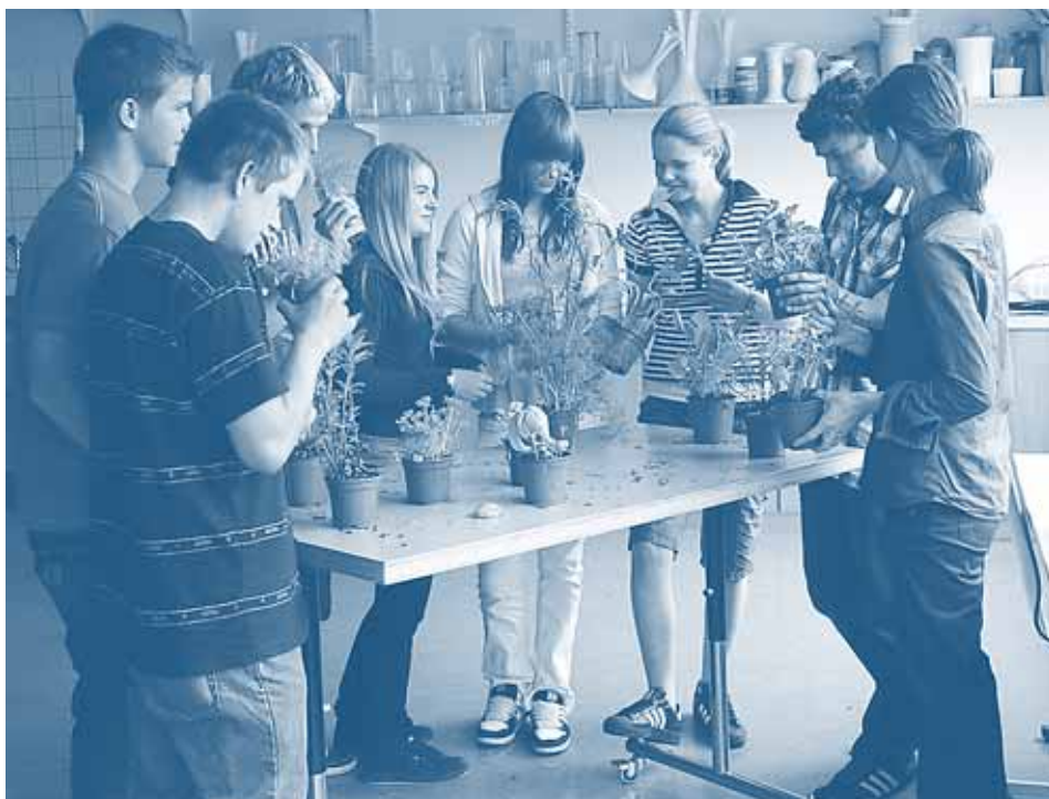
Praktischer Unterricht Gärtner/innen