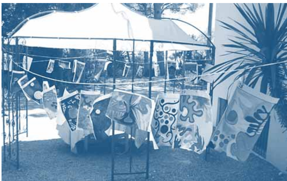
Farbenlehre in Varazze