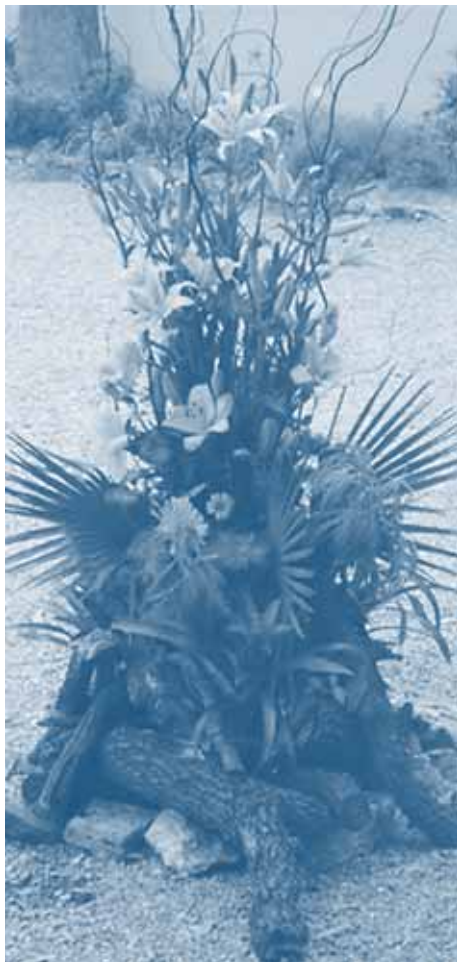
Arbeiten in Varazze

Gärtner/innen bei der Arbeit im Floristenatelier und eine kleine Sammlung von Zimmerpflanzen der Floristinnen im Gärtnertriebhaus. Jedes Jahr werden mit den Gärtnerklassen themenbezogene Blockwochen durchgeführt. Die Floristinnen absolvieren jedes Jahr in den Sommerferien eine Gestaltungswoche in Varazze; dies als Kompensation für Schultage, welche für die Arbeit im Betrieb reserviert sind (beispielsweise vor dem Muttertag). ::